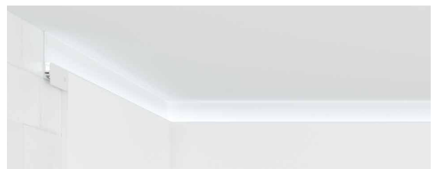
Universalprofil mit Sichtschenkel eingebaut in der Wand