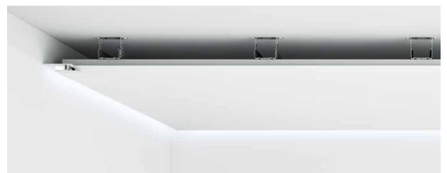
Universalprofil mit Sichtschenkel eingebaut in der Decke