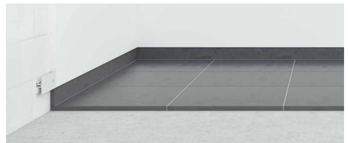
Sockelprofil mit wandbündiger Sockelfliese