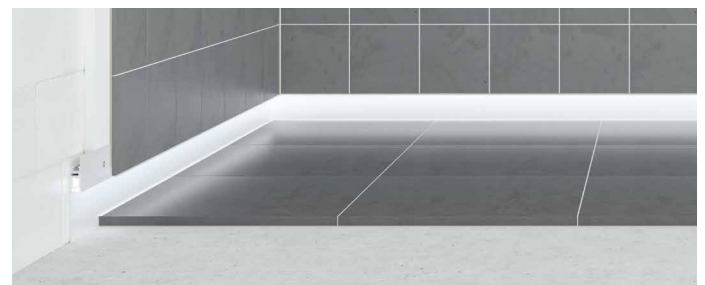
Sockelprofil mit zurückspringenden, indirekt beleuchteten Sockel