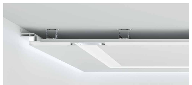
Linearbeleuchtung mit U-Aufnahme und Plexiglas-Abdeckung