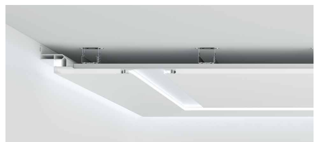
Linearbeleuchtung ohne U-Aufnahme mit seitlicher Kunststoff-Abdeckung