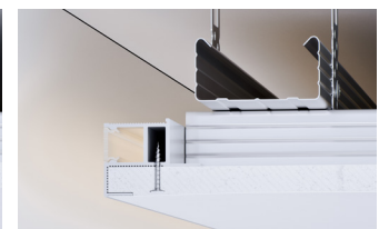
Schattenfugenprofil Individual ohne Sichtschenkel für schwebende Flächen