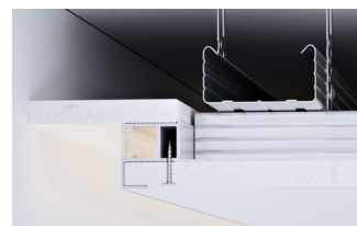
Schattenfugenprofil Individual mit Sichtschenkel gerade aus Trockenbauplatte