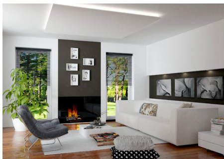
Rechteckiges Decken-Formteil mit umlaufender, indirekter Beleuchtung