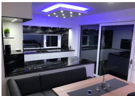
Quadratisches Decken-Formteil mit umlaufender, indirekter Beleuchtung und Einbaustrahler